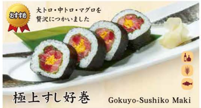
おすすめ 大トロ・中トロ・マグロを 贅沢につかいました