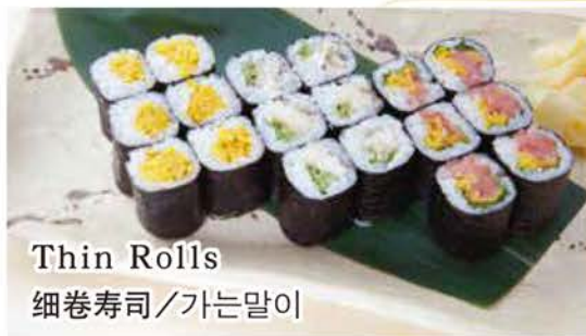
Thin Rolls 細巻寿司 / 가는말이