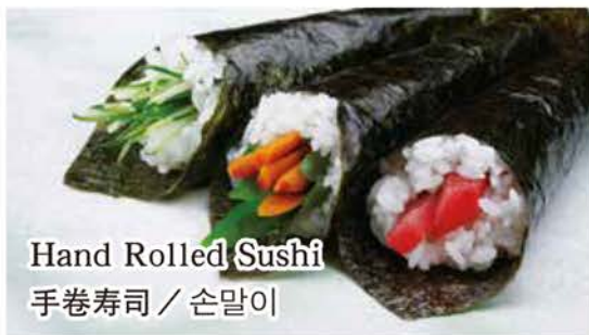
Hand Rolled Sushi 手巻寿司 / 손말이