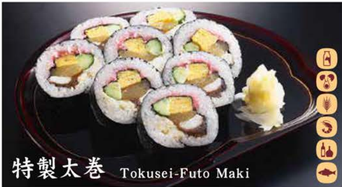
特製太巻 Tokusei-Futo Maki