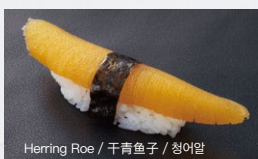
数の子 Kazunoko 500円 (税込 550円)