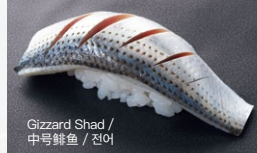
Gizzard Shad / 中号鲱鱼 / 전어