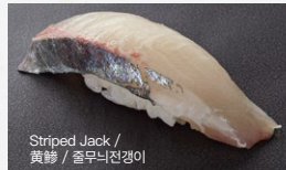
Striped Jack / 黄鲷 / 줄무늬전갱이