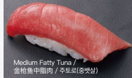
Medium Fatty Tuna / 金枪鱼中脂肪 / 주토로(중맛살)