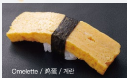
玉子 Tamago 90円 (税込 99円)