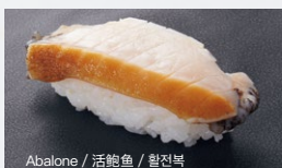
Abalone / 活鲍鱼 / 활전복