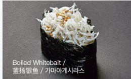
釜揚げしらす Kamaage-Shirasu 150円 (税込 165円)