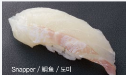
Snapper / 鲷鱼 / 도미