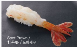
ぼたん海老 Botan-Ebi 800円 (税込 880円)