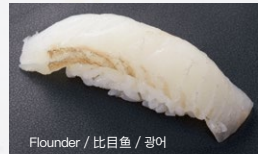
Flounder / 比目鱼 / 광어