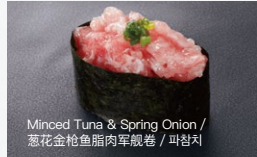
ねぎとろ軍艦 Negitoro-Gunkan 350円 (税込 385円)