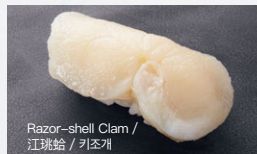
Razor-shell Clam / 江珧蛤 / 키조개