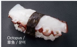
たこ Tako 200円 (税込 220円)