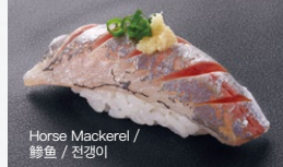
Horse Mackerel / 鲹鱼 / 전갱이