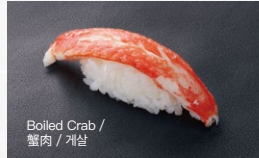
かに身 Kanimi 500円 (税込 550円)