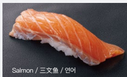
サーモン Salmon 300円 (税込 330円)