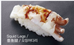
げそ Geso 90円 (税込 99円)