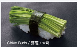
芽ねぎ Menegi 150円 (税込 165円)