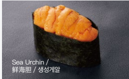
生うに Nama-Uni 800円 (税込 880円)