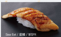
穴子 Anago 450円 (税込 495円)