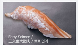
とろサーモン Toro-Salmon 400円 (税込 440円)