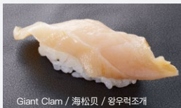
Giant Clam / 海松贝 / 왕우럭조개