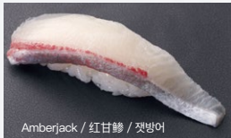
Amberjack / 红甘鲷 / 갯방어