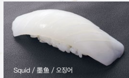
いか Ika 300円 (税込 330円)