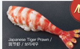
車えび Kuruma-Ebi 800円 (税込 880円)