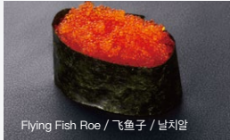
とびっこ Tobikko 90円 (税込 99円)