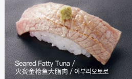
Seared Fatty Tuna / 炙金枪鱼大脂肪 / 아부리오토로