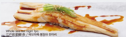
江戸前活穴子 1本 Edomae-Ikejime-Anago-Ippon 1,500円 (税込 1,650円)