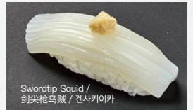
白いか Shiro-Ika 400円 (税込 440円)