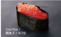
たらこ Tarako 150円 (税込 165円)