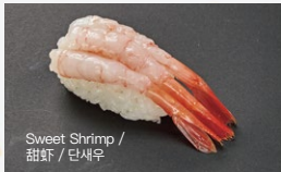
甘えび Ama-Ebi 350円 (税込 385円)