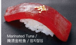
Marinated Tuna / 腌渍金枪鱼 / 참치절임