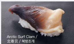
Arctic Surf Clam / 北寄贝 / 북방조개