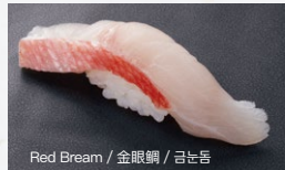
Red Bream / 金眼鲷 / 금눈돔