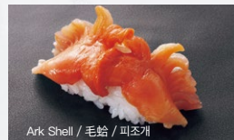
Ark Shell / 毛蛤 / 피조개