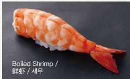
海老 Ebi 350円 (税込 385円)