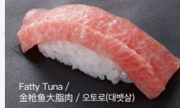
Fatty Tuna / 金枪鱼大脂肪 / 오토로(대맛살)