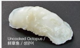
生たこ Nama-Tako 200円 (税込 220円)