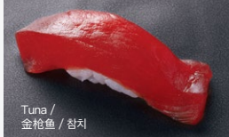
Tuna / 金枪鱼 / 참치