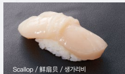
Scallop / 鲜扇贝 / 생가리비