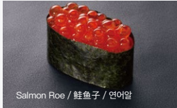
いくら Ikura 600円 (税込 660円)