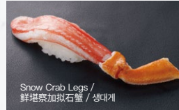
生ずわいがに Nama-Zuwai-Gani 800円 (税込 880円)