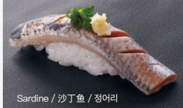
Sardine / 沙丁鱼 / 정어리