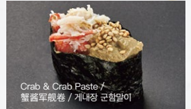
かに味噌軍艦 Kanimiso-Gunkan 400円 (税込 440円)