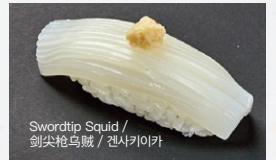
白いか Shiro-Ika 400円 (税込 440円)