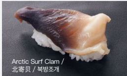
Arctic Surf Clam / 北寄贝 / 북방조개