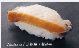
Abalone / 活鲍鱼 / 활전복