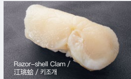
Razor-shell Clam / 江珧蛤 / 키조개