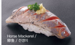
Horse Mackerel / 鲱鱼 / 전갱이