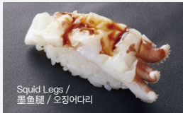
げそ Geso 90円 (税込 99円)