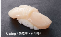
Scallop / 鲜扇贝 / 생가리비