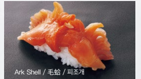
Ark Shell / 毛蛤 / 피조개