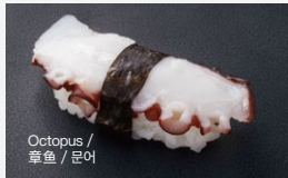
たこ Tako 200円 (税込 220円)