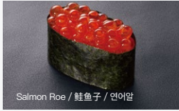
いくら Ikura 600円 (税込 660円)