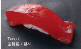
Tuna / 金枪鱼 / 참치