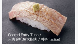
Seared Fatty Tuna / 炙金枪鱼大脂肪 / 아부리오토로