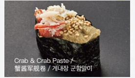
かに味噌軍艦 Kanimiso-Gunkan 400円 (税込 440円)