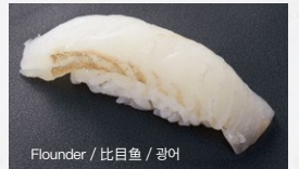
Flounder / 比目鱼 / 광어