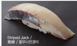
Striped Jack / 黄鲷 / 줄무늬전갱이