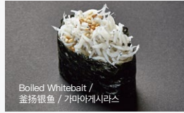
釜揚げしらす Kamaage-Shirasu 150円 (税込 165円)