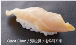
Giant Clam / 海松贝 / 왕우럭조개