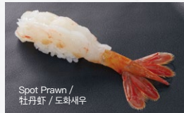
ぼたん海老 Botan-Ebi 800円 (税込 880円)