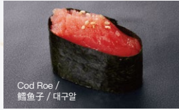
たらこ Tarako 150円 (税込 165円)