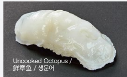
生たこ Nama-Tako 200円 (税込 220円)