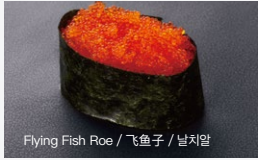
とびっこ Tobikko 90円 (税込 99円)